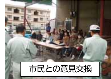
市民との意見交換