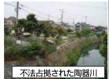
不法占拠された陶器川

土木事務所としてコストをかけて整備することは容易いが、少ない予算で環境に優しく、府民とのコミュニケーションを図りながら新しい川づくりができればという事を考えました